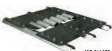
KIT PIASTRA ESTREMITA' 5 GRECHE 3 PROFILI

*IMPORTANTE, LA DEFINIZIONE DEI PROFILI PER LE PIASTRE DOVRA' AVVENIRE COMPILANDO LE ISTRUZIONI A FONDO PAGINA.