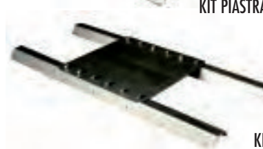
KIT PIASTRA INTERMEDIA' 5 GRECHE 2 PROFILI