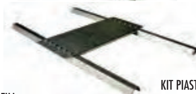
KIT PIASTRA INTERMEDIA' 3 GRECHE 2 PROFILI