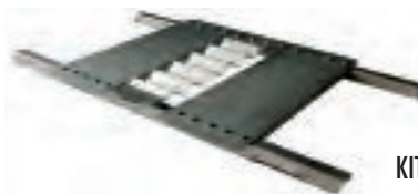
KIT PIASTRA ESTREMITA' 3 GRECHE 2 PROFILI